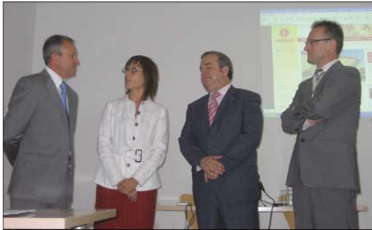
Un momento de la presentación del nuevo portal en internet de Panaderías "El Mimbres", además de la nueva imagen de marca

Además de su profunda implicación con otras empresas en la aplicación de I+D