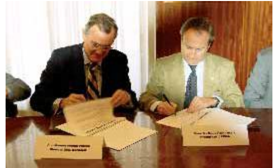
La firma del convenio se celebró el 11 de febrero.