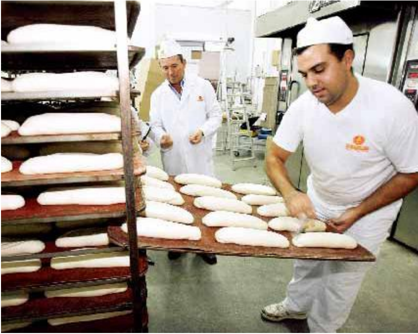
Entre los clientes de la compañía figuran Carrefour, Eroski e Ikea.