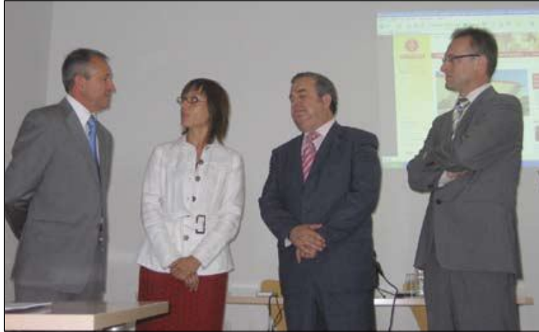
Un momento de la presentación del nuevo portal en internet de Panaderías "El Mimbres", además de la nueva imagen de marca

Además de su profunda implicación con otras empresas en la aplicación de I+D